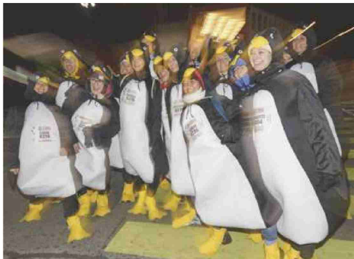
Dans la bise, certains avaient trouvé le déguisement polaire adéquat.