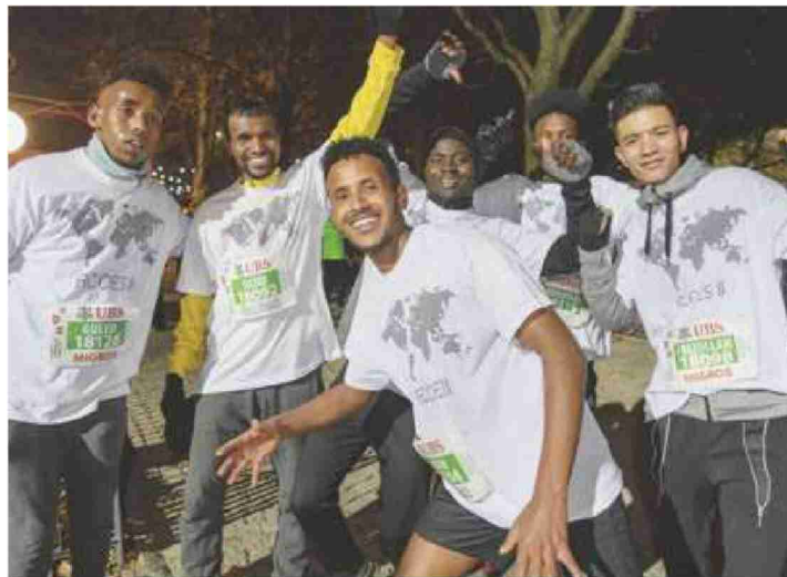
Un groupe de réfugiés n'a pas hésité à disputer la course.

se sont inscrits pour cette 40 e édition, un record absolu pour une course en Suisse. L'ancien record était de 45 322 concurrents, l'an passé au même endroit. ☺