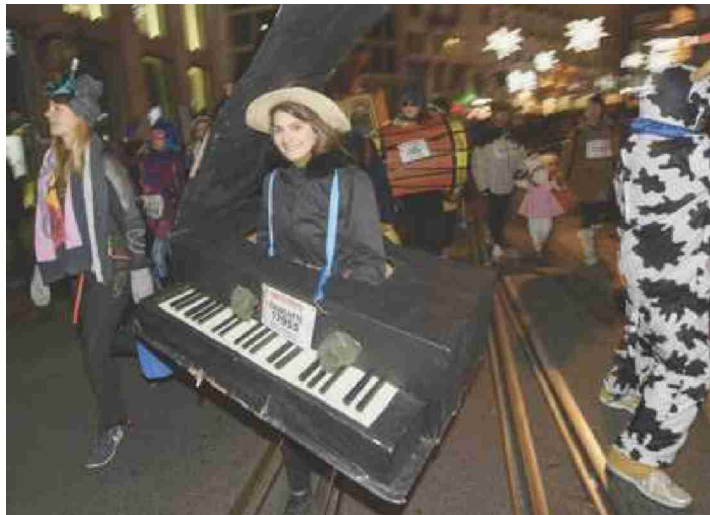
«Courir sans mon instrument? Jamais de la vie».